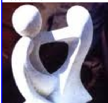
Sculpture "Combteud" de Yann Jost

Ben encadrant pour sa part les ateliers de danse africaine. Inspirée des animaux, la danse africaine est avant tout un moyen d'expression qui sollicite toutes les parties du corps. C'est pieds nus que les jeunes et les enfants ont exécuté des figures et acrobaties au son du djembé. Frappements de mains et de pieds, sauts, ondulations : tous ces mouvements se pratiquent genoux fléchis et dos cambrés. Les adultes de l'association Sport-