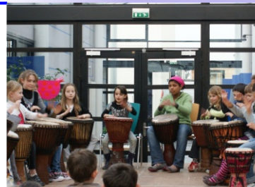
Démonstration de Djembé par les enfants

Expression-Culture (SEC) de Rosheim ont clôturé ce spectacle avant que les 80 convives rejoignent leurs tables pour déguster une spécialité togolaise préparée par une famille bénévole et membre du Centre. Une rencontre interculturelle et intergénérationnelle qui a fait l'unanimité.