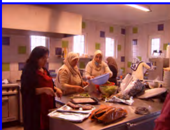
Quelques dames en plein préparatif

La première semaine de mai a permis à 35 femmes, mères, grand-mères, bénévoles de tous âges et de toutes origines de participer au Festival Pisseurs d'Etoiles.